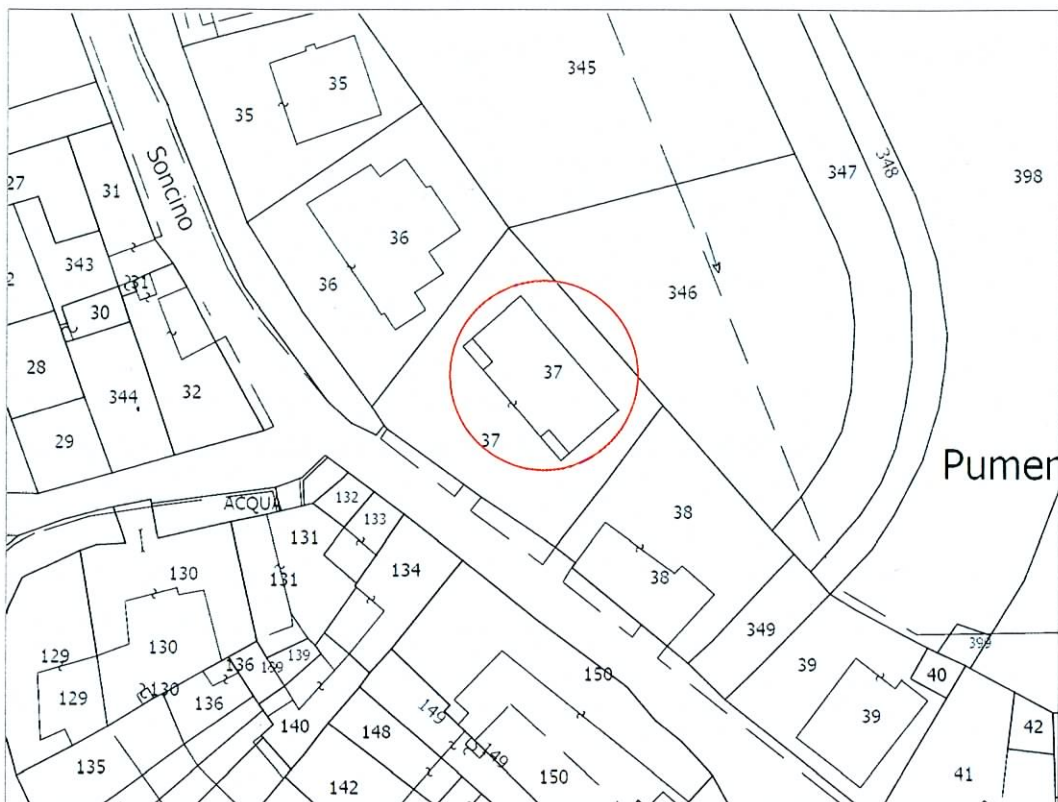
ESTRATTO MAPPA (scala 1:1000)