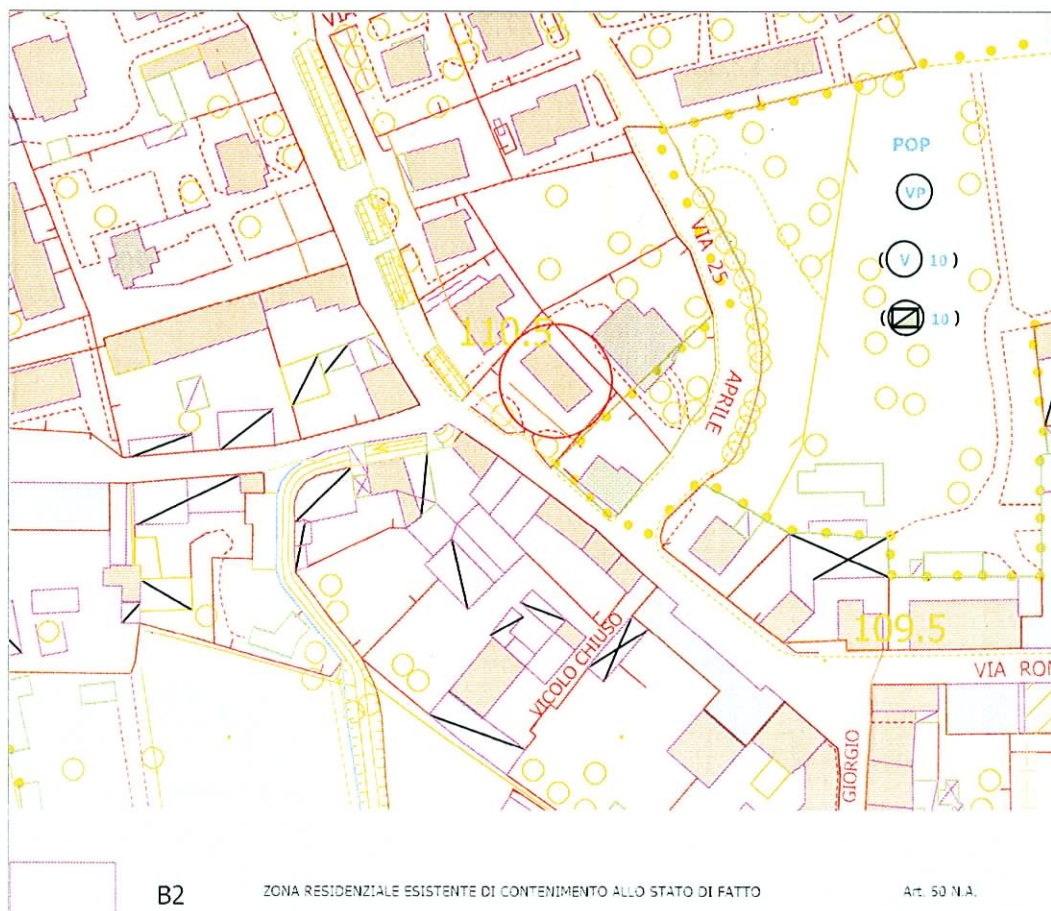
ESTRATTO P.R.G vigente (scala 1:2000)